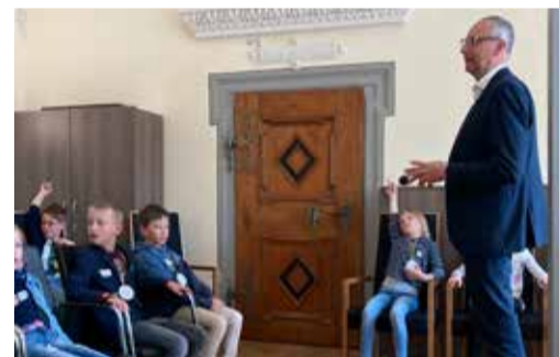
Was macht eigentlich ein Oberbürgermeister?