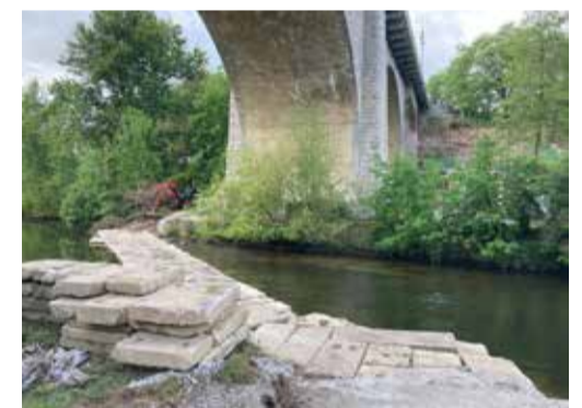
Behelfsquerung über der Spree

Die Bauarbeiten zur Sanierung der Stützwand entlang der Treppenanlage von der Friedensbrücke zum Uferweg haben begonnen. Für die Einrichtung ihrer Baustelle hat die bauausführende Firma Steinle Bau GmbH einen Teil der Parkflächen an der Fischergasse gesperrt. Die Treppenanlage selbst wird während der Bauarbeiten nicht begehbar sein. Zunächst errichtet die Firma eine Baustellenzufahrt durch die Spree und eine Baustraße bis zur eigentlichen Baustelle heran, bevor die eigentlichen Sanierungsarbeiten an der Stützwand beginnen. Die Bauarbeiten werden voraussichtlich bis Anfang November 2024 dauern.