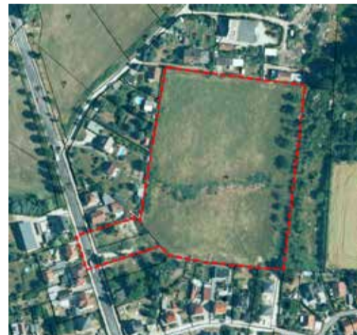
„Wohngebiet Südhöhe Bautzen – Oberkaina“

Geltungsbereich vorhabenbezogener Bebauungsplan