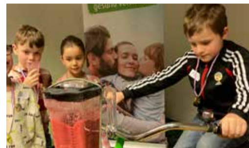
Gesund bewegt: Das Smoothiebike