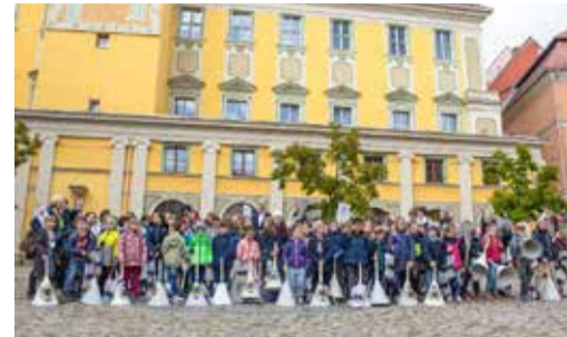
Über 100 Kinder und ein Oberbürgermeister

teilnehmen zu dürfen. Neben den vielen Erlebnissen nahmen sie ihre Bastelergebnisse, kleine Geschenke und Antworten auf Fragen mit nach Hause, die sie dem Stadtoberhaupt in der Sprechstunde stellen konnten. Zu den Partnern gehörte in diesem Jahr u. a. die Kinder- und Jugendbibliothek, das Museum Bautzen, der Kreissportbund Bautzen e.V., der BLV „Rot-Weiß 90“ e.V., die Firma SPORTIVATION, die AOK Plus und viele kleine und große Helfer, darunter auch der 8. Klassen der Dr. S.-Allende-Oberschule.