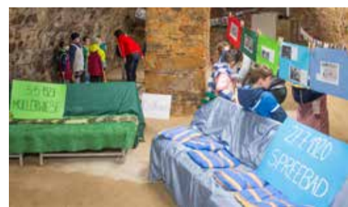
Kellergeschichten im Rathaus.