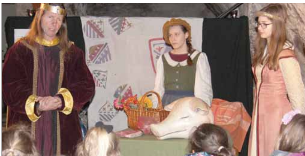
König Wenzel besuchte die Station im Kellergewölbe des Rathauses und erklärte den Gästen gemeinsam mit der Kinder- und Jugendbibliothek, warum Bautzen den ältesten Weihnachtsmarkt Deutschlands hat.