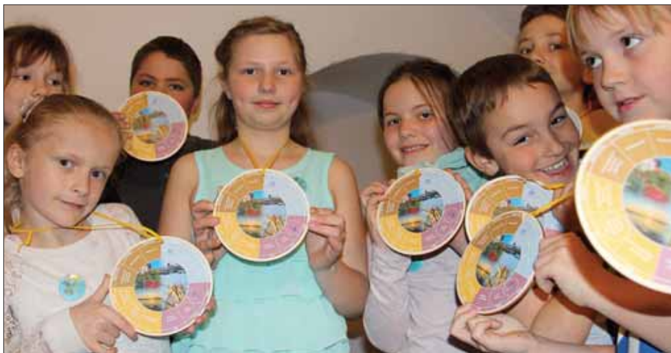
Immer mit dabei: die Jahresuhr, die an ihrem Hals „baumelte“. Diese bunte Holzscheibe zeigt alle Events, die im Laufe eines Jahres in Bautzen gefeiert werden.

Leider muss auch das schönste Bautzener Veranstaltungsjahr einmal enden – am besten mit einem Highlight. Deshalb feierten alle Kinder zum Abschluss ihres großen Tages gemeinsam das Internationale Folklorefestival. Junge Tänzerinnen und Tänzer des Sorbischen Folklorensembles Höflein begeisterten mit einer schwungvollen Darbietung. Wer sich nach einem ereignisreichen Tag erschöpft zurücklehnen wollte, musste sich noch ein wenig gedulden. Wer Lust darauf hatte, konnte sogar selbst mit der Folkloregruppe tanzen. Auch wenn sich die kleinen Gäste anschließend mit vielen Eindrücken im Gepäck auf den Heimweg machten, wissen sie spätestens nach dem heutigen Tag eines ganz genau: Der nächste Veranstaltungshöhepunkt kommt ganz bestimmt!