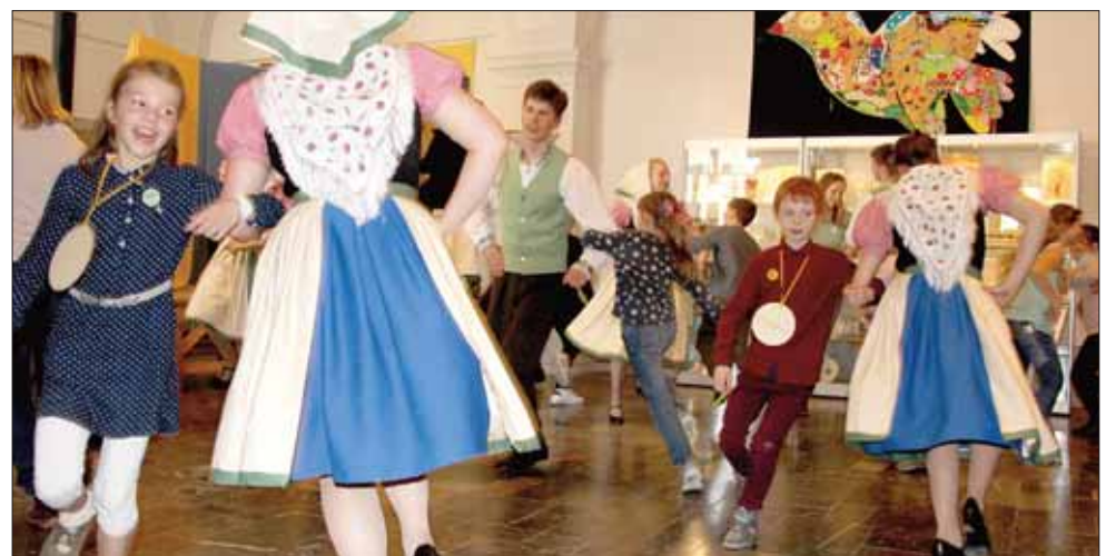
Mit einem gemeinsamen Tanz klang die Veranstaltung aus. Die Tanzgruppe des Sorbischen Folklorensembles Höflein warb für das Folklorefest im Sommer.